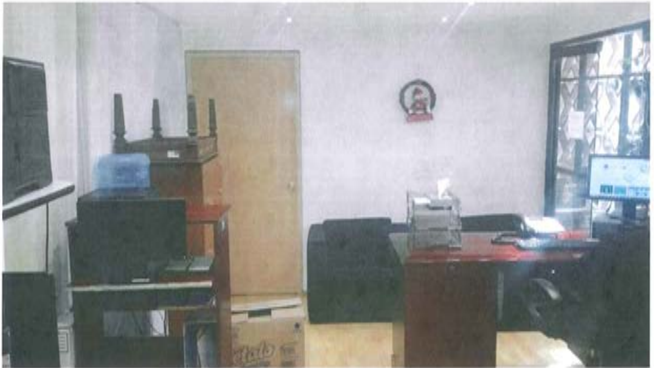
Área laboral del personal y al mismo tiempo sala de juntas