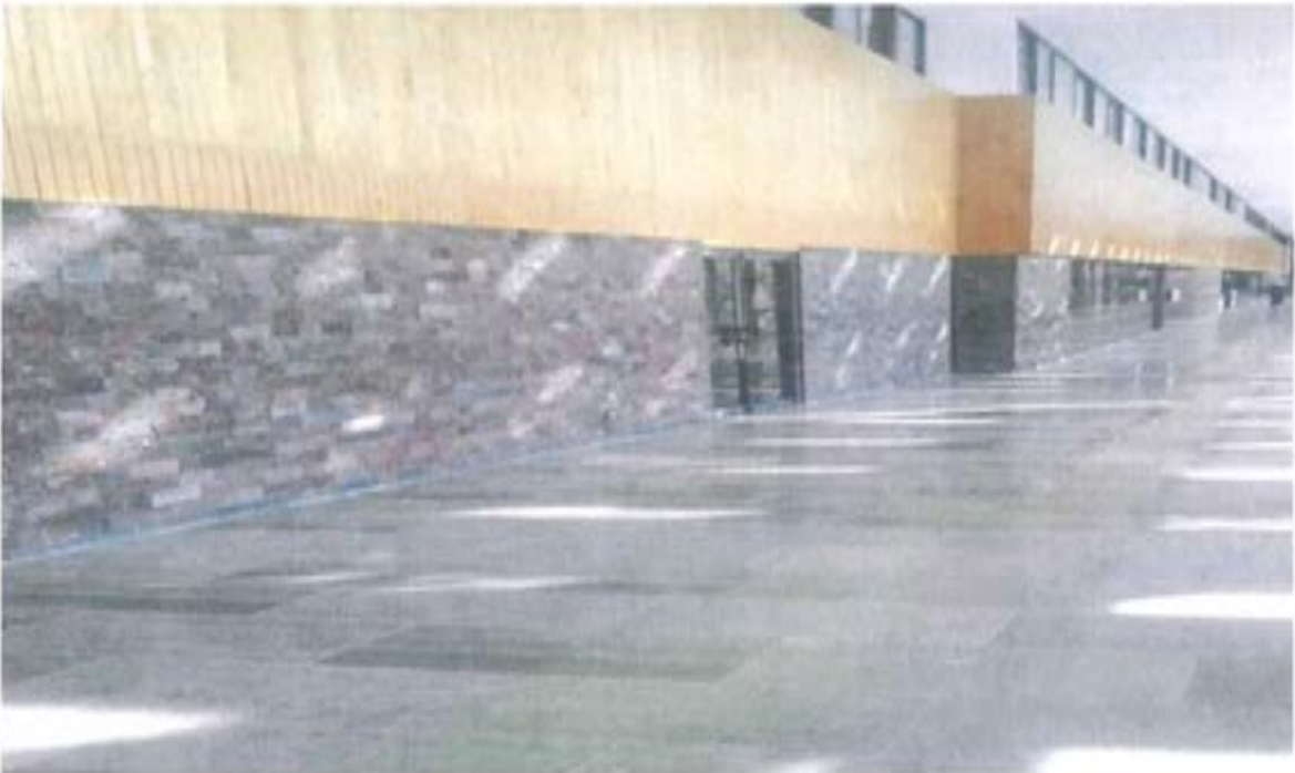
Después de la remodelación