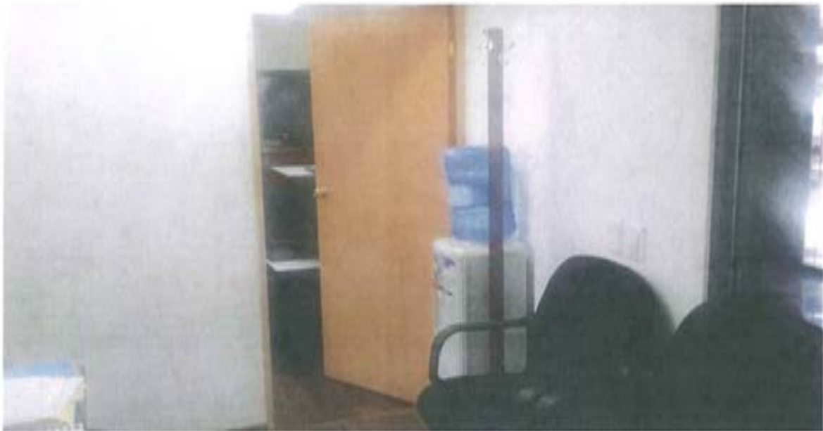
Área de Fotocopiado