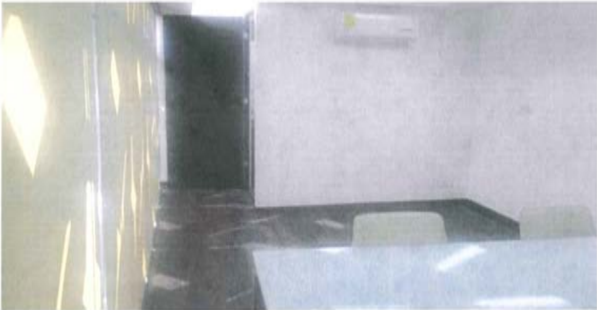
Oficina Diputado Presidente