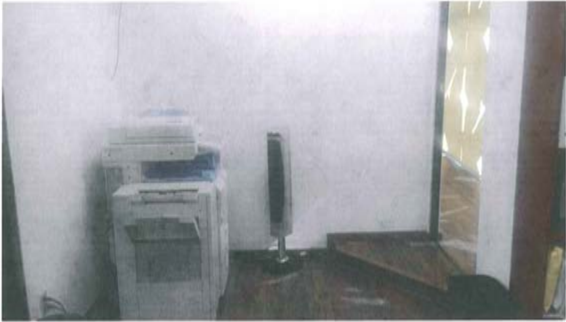
Área secretaria y recepción