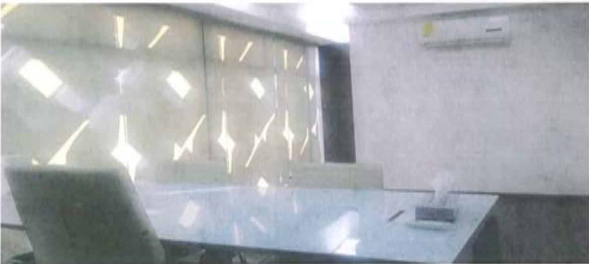
Oficina del Secretario Técnico y Asesores