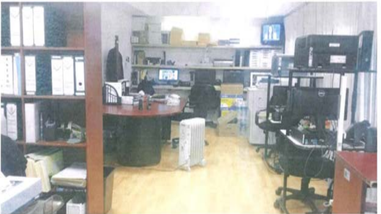
Oficina del Secretario técnico y asesores